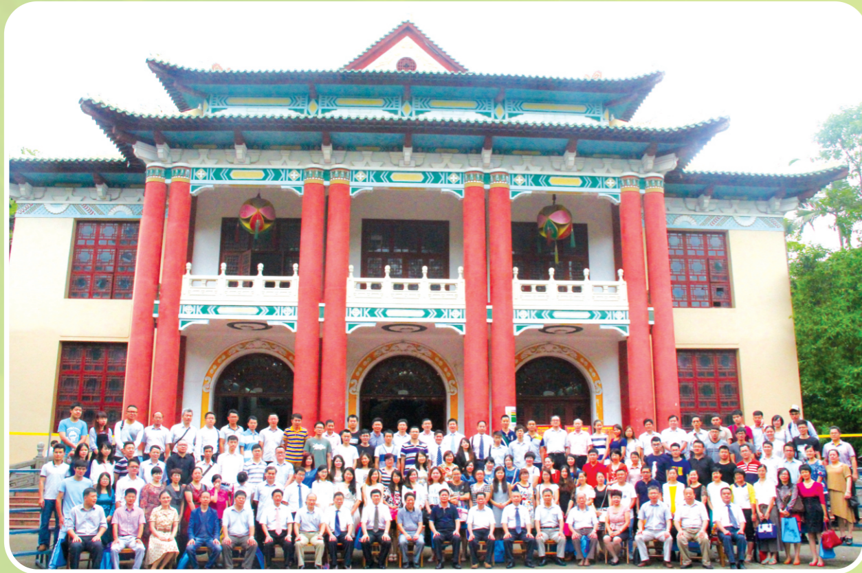
出席商学院10周年院庆领导、嘉宾、校友及师生合影