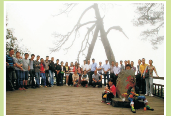
员工开展旅游拓展活动

目前,公司拥有一批具有丰富实践管理经验的专家、顾问和技术精湛、朝气蓬勃的软件开发、系统集成专业技术团队。在软件上,自主研发了“野外设备失窃追踪系统”、“视频指挥调度系统”、“野外工程项目管理系统”、“社保手机客户端”等。在项目建设上,完成了包括视频监控、预警监测、森林防火、数字通讯、网络工程、安防工程、楼宇智控、机房建设等众多系统集成项目。客户遍及政府、通讯、教育、金融、房地产等各类政企行业。承担广西森林火险预警监测系统、防城港市林业局林火视频监控系统等森林防火项目,得到了客户充分的肯定和高度赞扬。