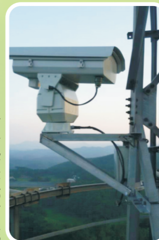
林火视频监控系 统